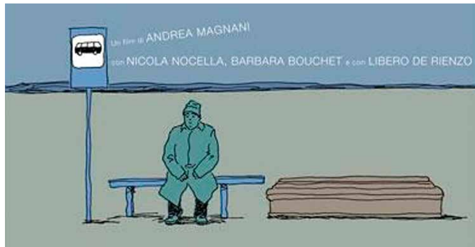
Easy - Un viaggio facile facile

Giovedì 23 luglio ore 21.30 Piazza Marconi, Calderara