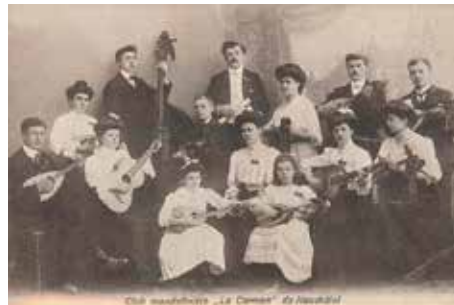
Orchestra Popolare dei Mandolini