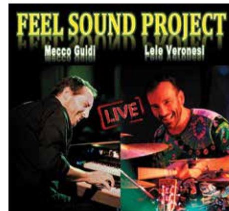
Feel Sound Project

Il concerto è un viaggio tra composizioni originali, standard jazz e musiche da film. Il dialogo tra i due musicisti è un percorso di dinamiche ed energia, di continui sviluppi e creazione, cercando di emozionare ed emozionarsi.