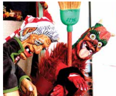
A spasso con Sandrone

Sabato 8 agosto ore 19:30 e 21:30 (2 repliche) Centro Sociale di Longara