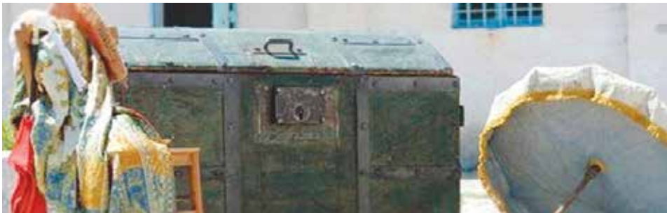
La stoffa dei sogni