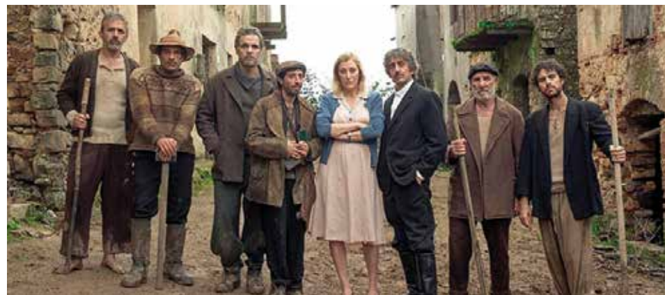
Aspromonte - La terra degli ultimi

Giovedì 6 agosto Centro sociale di Longara