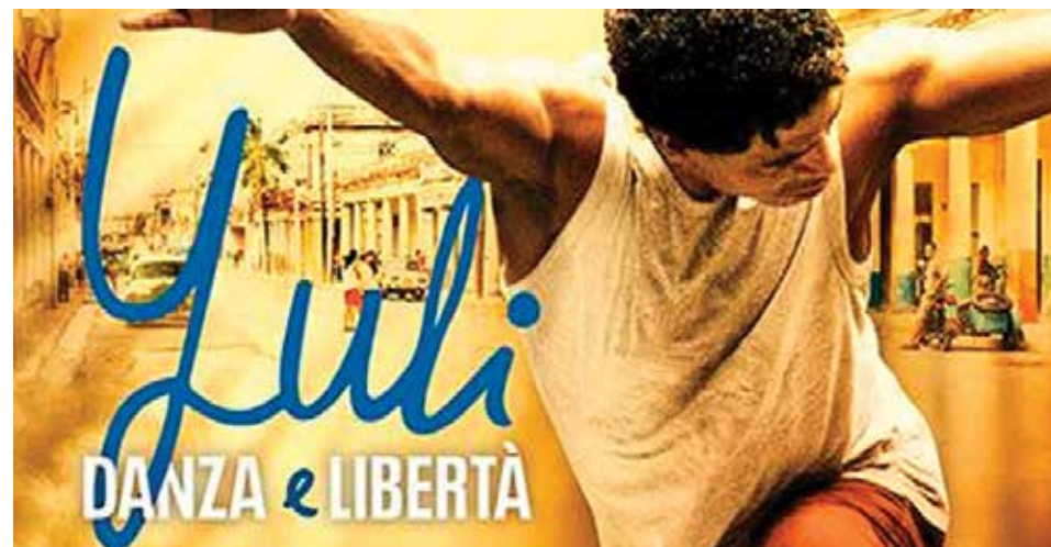
Yuli - Danza e libertà

Giovedì 30 luglio ore 21.30 Piazza Marconi, Calderara